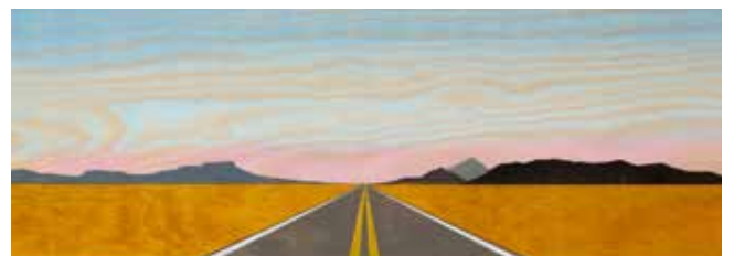
Go West Young Man, Olja & lack på plywood 20 x 56 cm, 2017, Pris 5 000:-