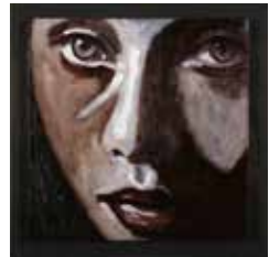
Glasartad Blick Olja & glas på plywood 24 x 24 cm, 2011&2015 Pris 3 800:-