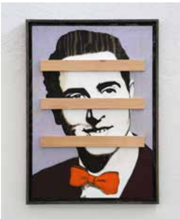
En Orange Fluga Olja på plywood, 50 x 35 cm, 2014 Pris 6 000:-