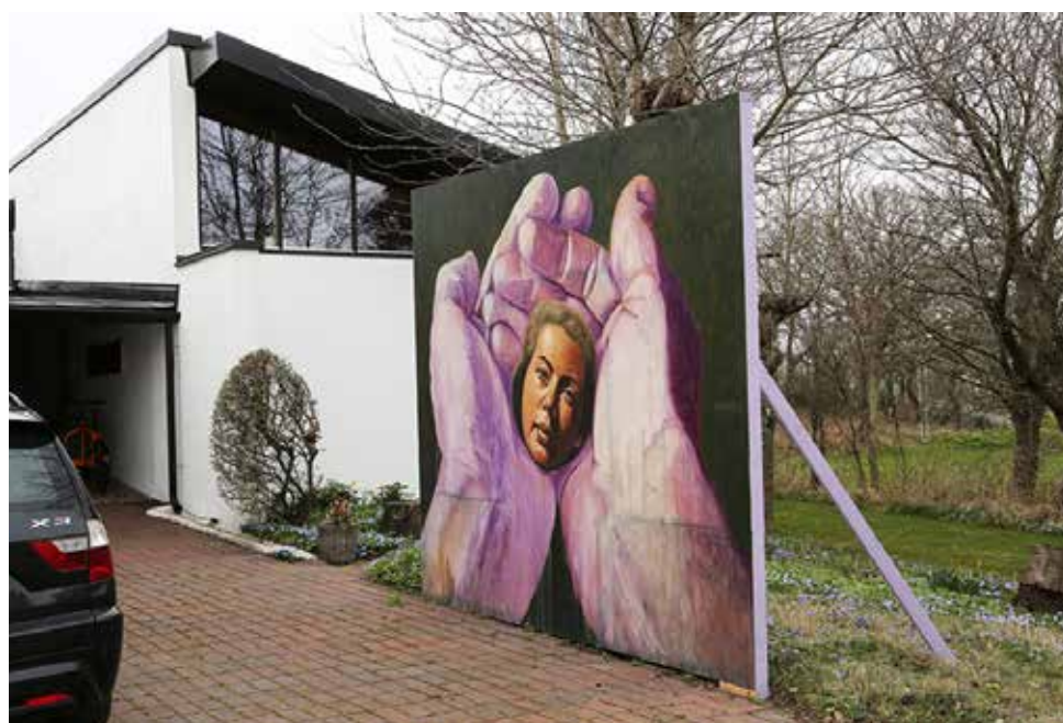
Precious Olja på plywood 300 x 360 cm, 2014 Målad för utställning på Galleri Tapper Popermajer i Teckomatorp där den satt monterad utomhus i ca 2,5 år.