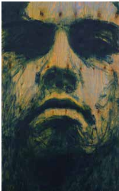
Metamorface I Olja på plywood, 96 x 60 cm, 2009 Pris 13 000:-