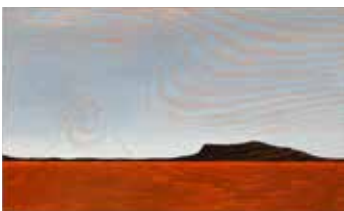
Land of Longing Olja & lack på plywood 12 x 20 cm, 2017 Pris 3 000:-