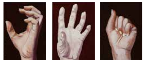
Hand Painting No. 2, 3 and 4 Olja och lack på björkplywood 14 x 10 cm, 2015 Pris 3 300:- / st