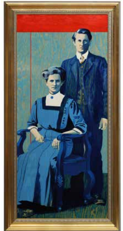
Meeting Creek, Canada, 1911 Olja och lack på plywood 133 x 60 cm, 2014 Pris 26.000:- inkl. guldrum (den var dyr...)