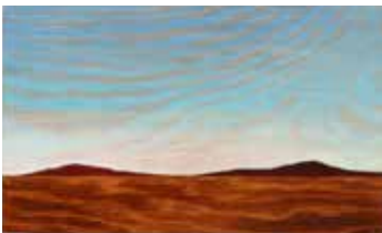
Sacred Mountains Olja & lack på plywood 12 x 20 cm, 2017 Pris 3 000:-