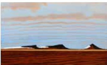
A Cold Day in the Desert Olja & lack på plywood 12 x 20 cm, 2017 Pris 3 000:-