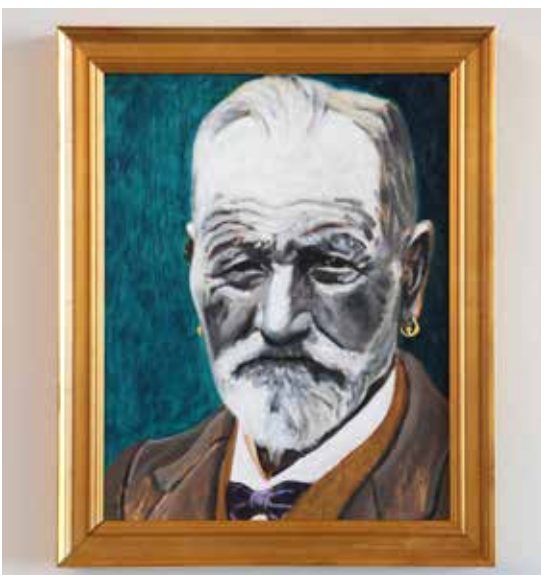
Sjökaptenen Olja på plywood 36,5 x 29,5 cm med ram 2016 Gåva till Ruffen i Arild