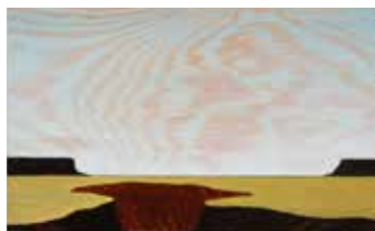
The Land of Mesas and Canyons Olja & lack på plywood 12 x 20 cm, 2017 Pris 3 000:-