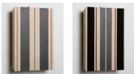
Lines No. 18 & 20, Olja, lackfärg, grafit, etc. på björkplywood 14 x 10 cm, 2014, Pris 3 000:- / st