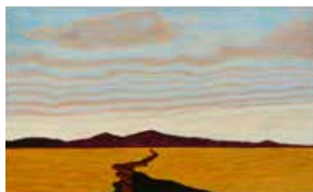
The Fault Line Olja & lack på plywood 12 x 20 cm, 2017 Pris 3 000:-