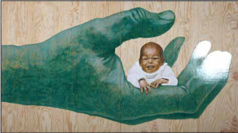
It's a Wonderful World Olja och lack på plywood 89 x 161 cm, 2014 Pris 19 000:-