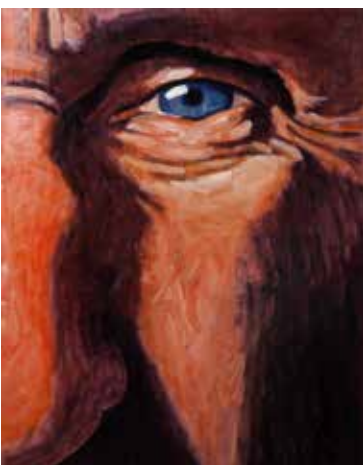
Närstudie 7 Olja och lack på plywood 76 x 60 cm, 2012 Pris 7 900:-