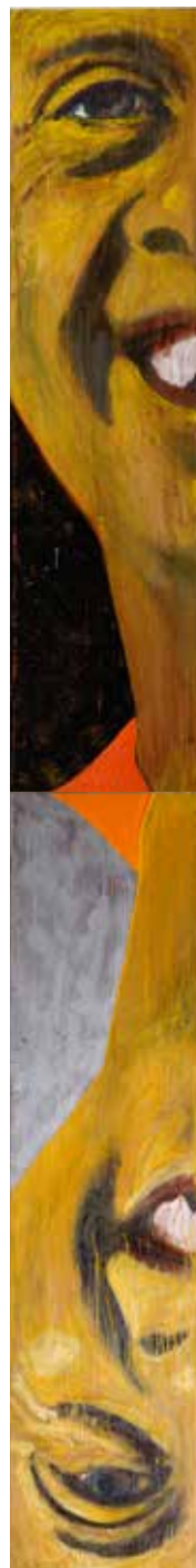
Tältplatsen Olja på plywood 240 x 30 cm, 2011 Pris 14 000:-