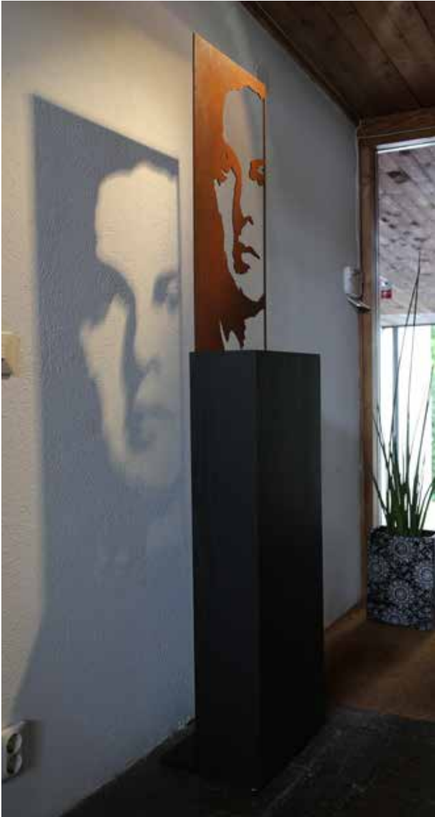
Transparent Personality (fristående skulptur) Stålplåt 4 mm & trä, 176 x 38 x 28 cm, 2015 Pris 14 000:-