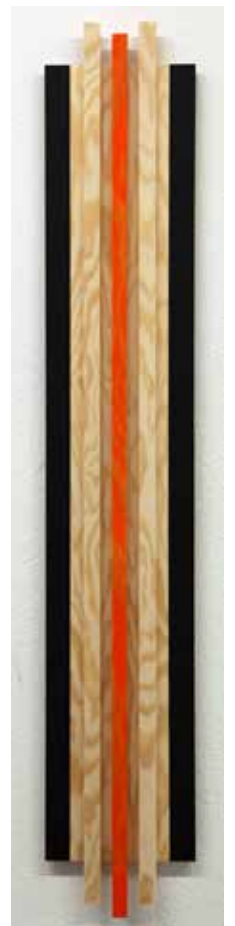
Lines No. 5 Olja, lackfärg, grafit, etc. på plywood 89 x 15 cm, 2014 Pris 4 400:-