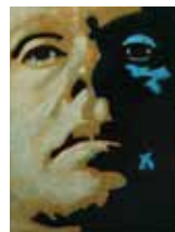
Split Personality Olja och lack på plywood 20 x 15 cm, 2012 Pris 3 800:-