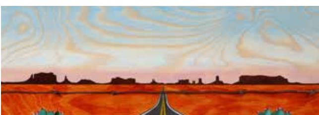
Welcome to the Navajo Nation, Olja, taggtråd & lack på plywood, 20 x 56 cm, 2017, Pris 5 000:-