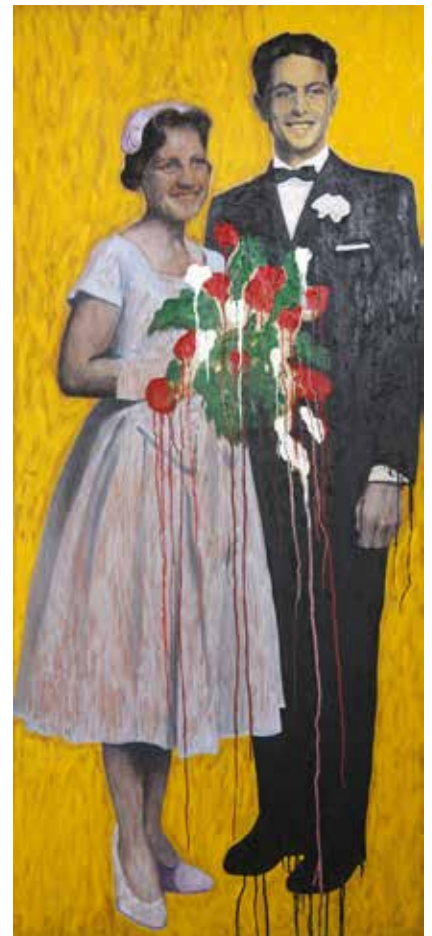
Guldröllop Olja på plywood, 180 x 80 cm, 2009 20 000:-