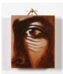
The Wise Young Man Olja & lack på plywood 7,5 x 6,2 cm, 2016 Pris 2 500:-