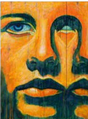
Forgetting your mirror image Olja på plywood, 64 x 48 cm, 2010 7 000:-