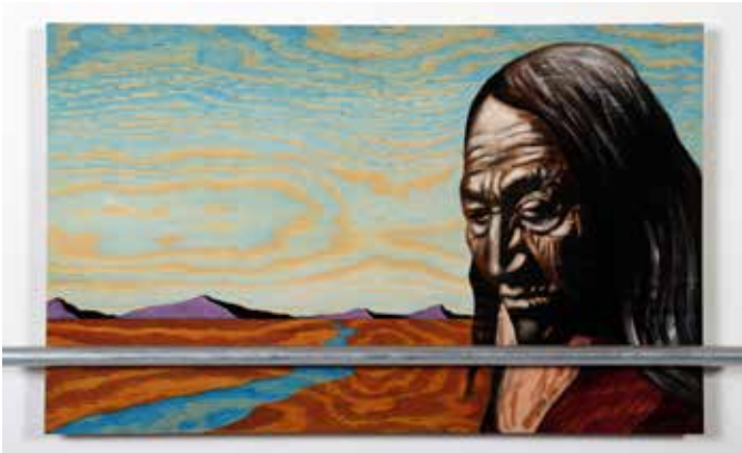
Water Protectors Olja, stålör & lack på plywood 20 x 56 cm, 2017 Pris 8 000:-