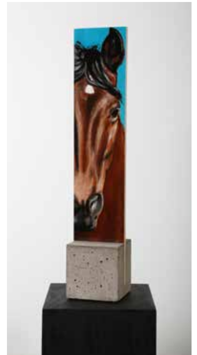
The Navajo Horse Olja & Lack på plywood med fot av betong 50 x 10 x 10 cm, 2017 Pris 6 000:-