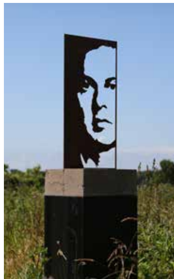
Transparent Personality (fristående skulptur) Stålplåt 4 mm & betong 90 x 37,5 x 37,5 cm, 2015 Pris 18 000:-