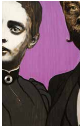
The washer woman Mixed media på plywood 40 x 26 cm, 2015 Pris 5 000:-