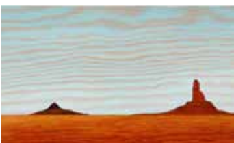
Navajo Homeland Olja & lack på plywood 12 x 20 cm, 2017 Pris 3 000:-