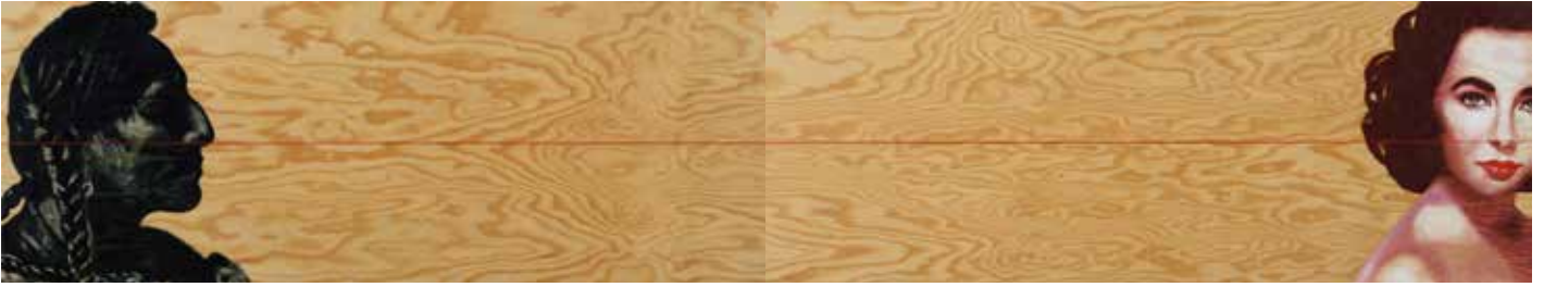
Origin and Icon, Olja på plywood, 40 x 220 cm, 2013, Pris 18 000:-