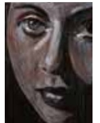
Study of V No. 2 Olja och lack på björkplywood 14 x 10 cm, 2015 Pris 3 500:-