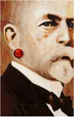
Modern Times Mixed media på plywood 38 x 24 cm, 2015 Pris 5 000:-