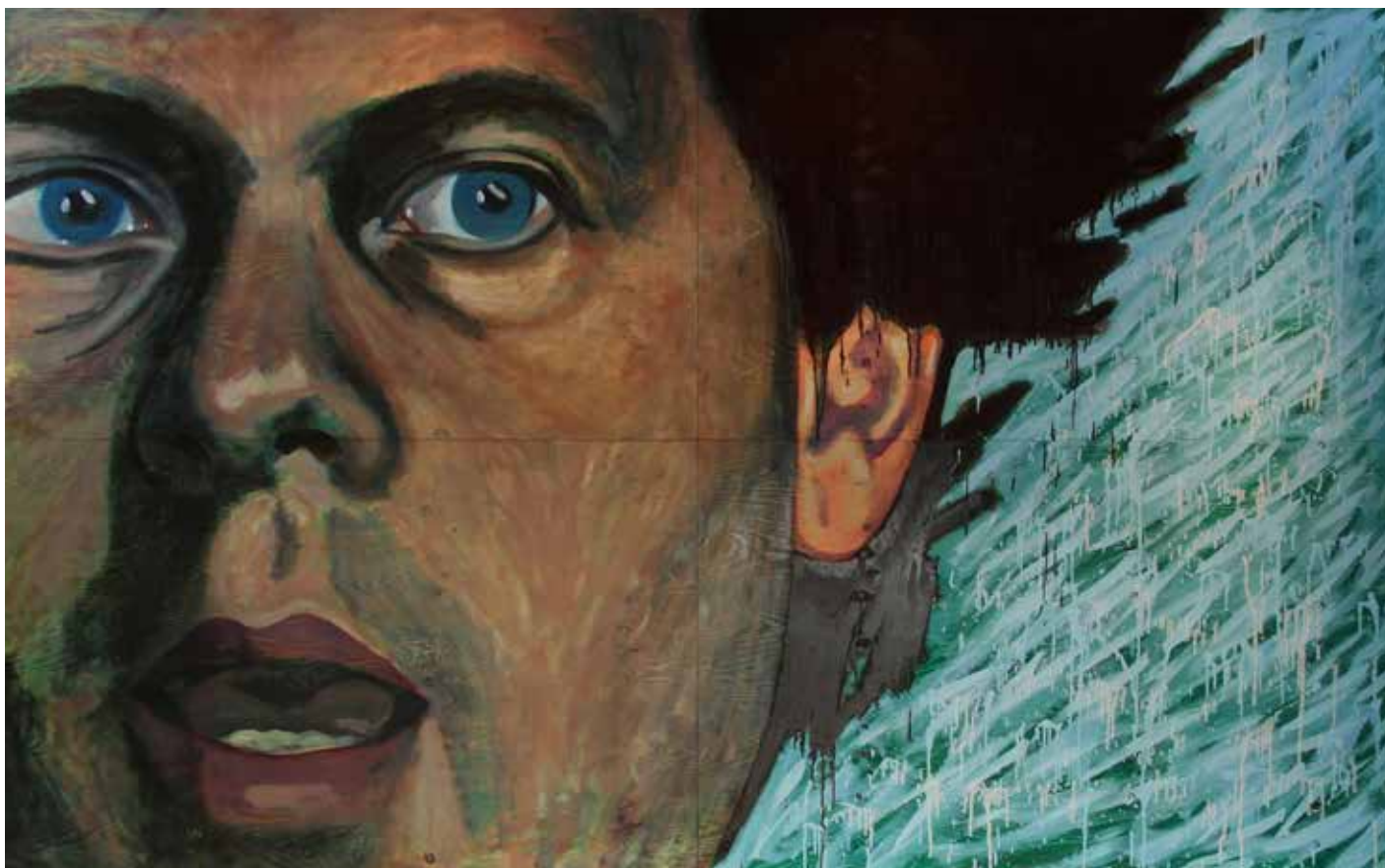
Stor Närvaro Olja på plywood 200 x 320 cm, 2010 Pris på förfrågan