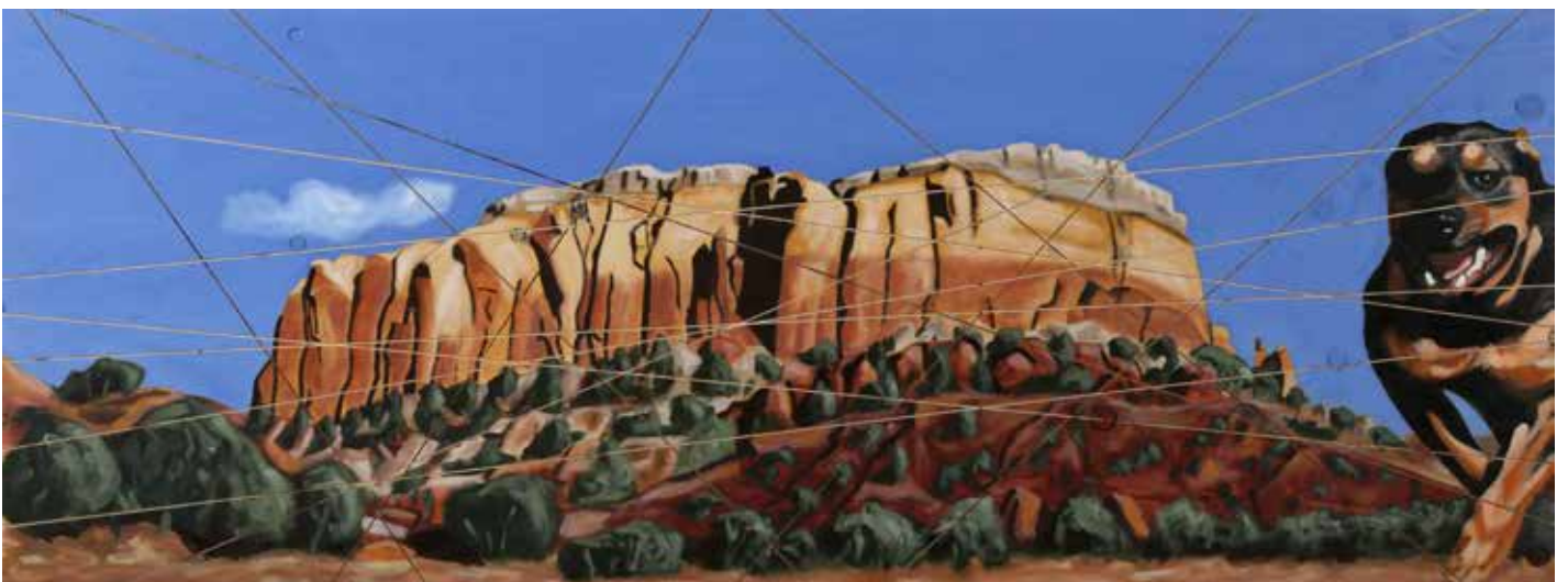
The Truth about Cuts and Dogs, Olja på plywood, 60 x 160 cm, 2013, Pris 18 000:-