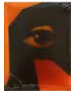
Djupsinnighet Olja & lack på plywood, 15 x 12 cm, 2014 3 400:-