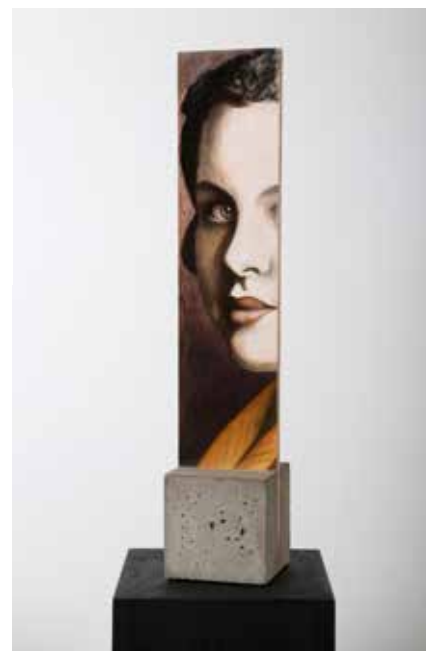
Svunnen Ungdom Olja & Lack på plywood med fot av betong, 50 x 10 x 10 cm, 2017 Pris 6 000:-