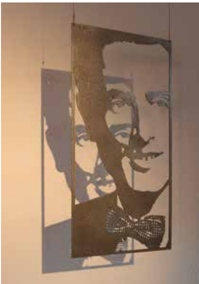
Sverre stålplåt 4 mm Serie 10 st 60 x 30 cm 2017 Pris 7 000:-/st