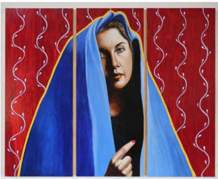
Girl with Red Finger Nail Olja och lack på plywood Triptyk 58 x 24 / del, 2017, Pris 21 000:-