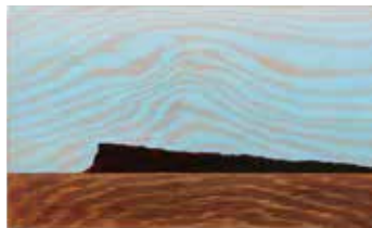
Receding Mesa at Dusk Olja & lack på plywood 12 x 20 cm, 2017 Pris 3 000:-