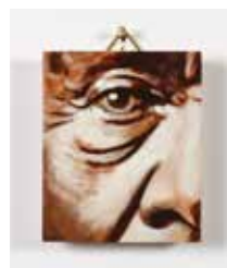
The Wise Old Man Olja & lack på plywood 7,5 x 6,2 cm, 2016 Pris 2 500:-