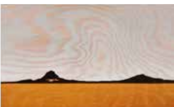
Winter in the Desert Olja & lack på plywood 12 x 20 cm, 2017 Pris 3 000:-