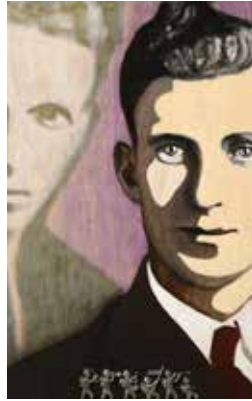
Brothers went to war Mixed media på plywood 38 x 24 cm, 2015 Pris 5 000:-