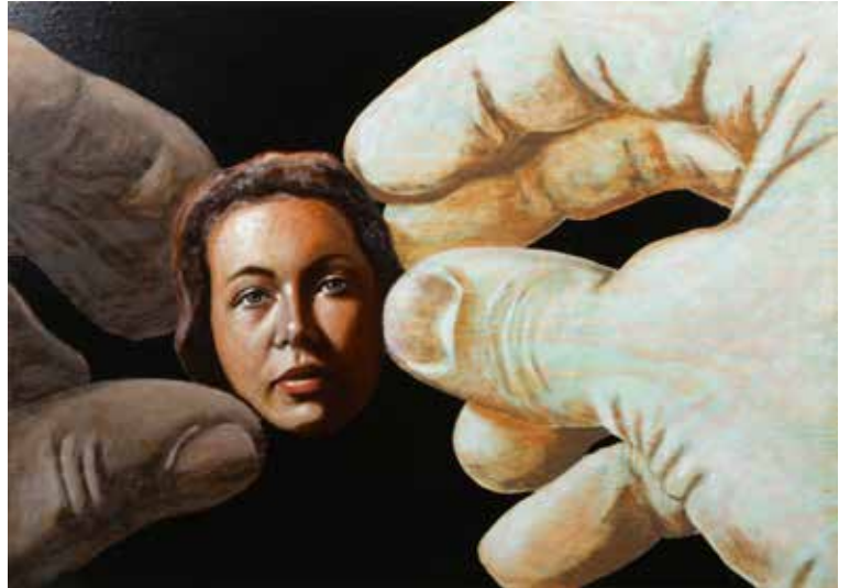
Jag har Funnit Flickan i Mina Drömmar Olja på plywood 54 x 76 cm, 2014 Pris 15 000:-