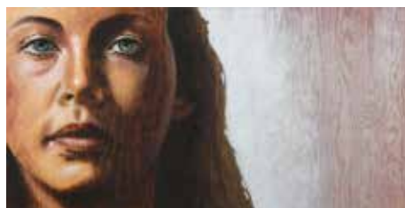
Förvandling I Olja och sprayfärg på plywood 40 x 80 cm, 2009 (Pris 11 000:-) del ett av en triptyk