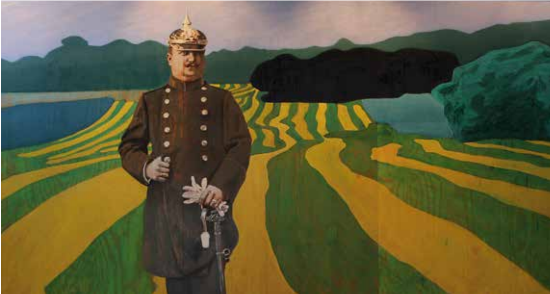
Apotekaren Olja på plywood 160 x 300 cm 2011 Pris på förfrågan