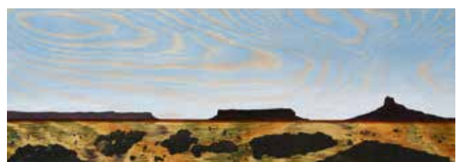
Boulders and Mesas, Olja, skiffer & lack på plywood 20 x 56 cm, 2017, Pris 5 000:-