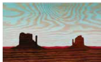
Monumental Vastness Olja & lack på plywood 12 x 20 cm, 2017 Pris 3 000:-