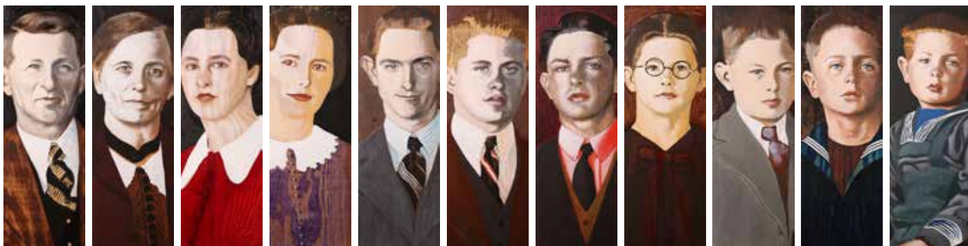
Familjesviten – Ny version, olja på plywood, 11 delar 60 x 20 cm, 2016 Privat ägo