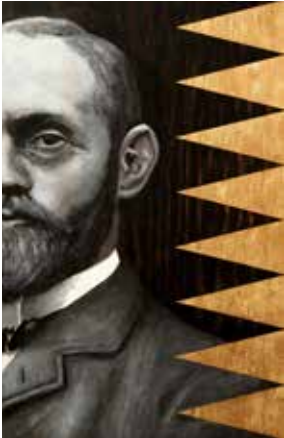
The golden years Mixed media på plywood 40 x 26 cm, 2015 Pris 5 000:-