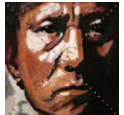
Nailed Mixed media på plywood 20 x 20 cm, 2016 Pris 3 800:-