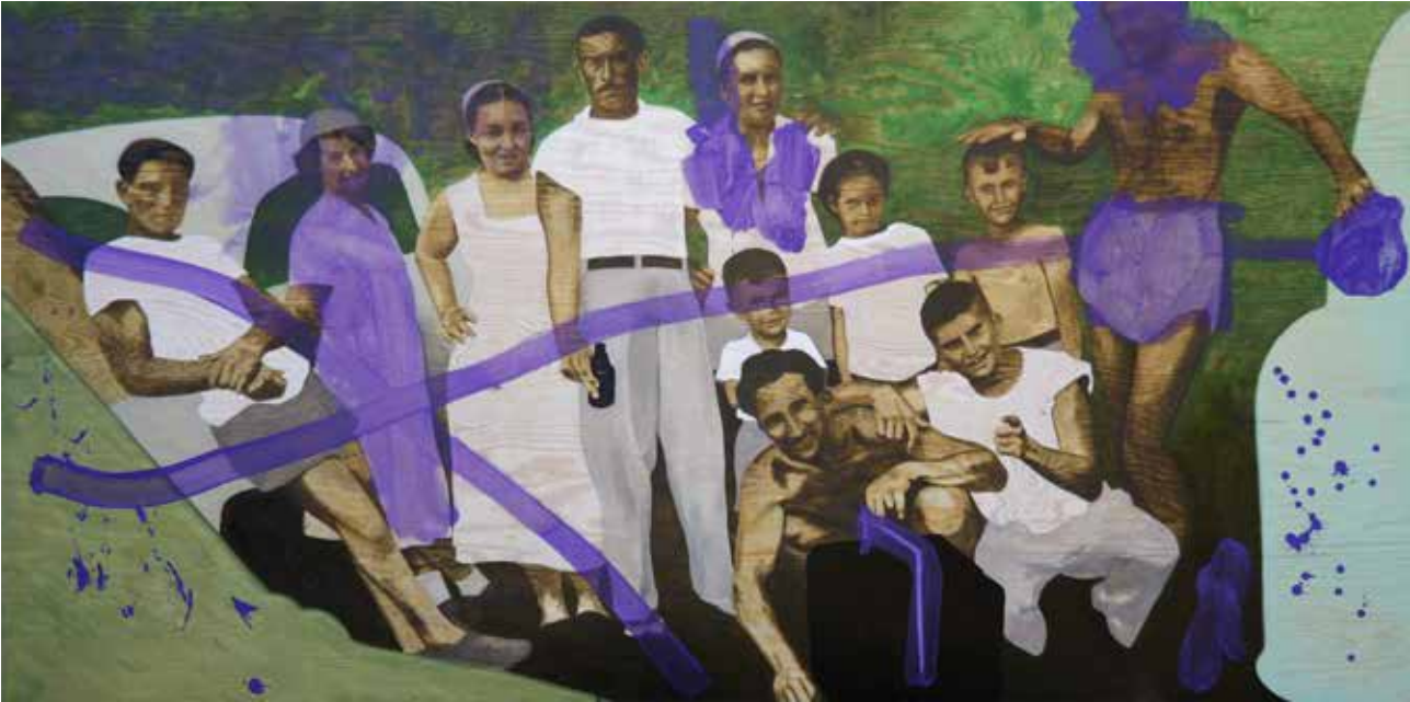
Aliquippa, Olja på plywood, 120 x 240 cm, 2009, Privat Ägo