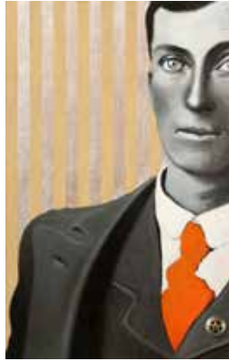
The deputy Mixed media på plywood 38 x 24 cm, 2016 Pris 5 000:-