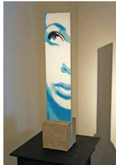
Reverence 1 Olja & Slagmetal på plywood med fot av betong, 50 x 10 x 10 cm, 2016 Pris 6 000:-