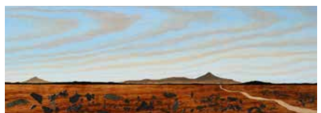
Road to Nowhere, Olja, skiffer & lack på plywood 20 x 56 cm, 2017, Pris 5 000:-