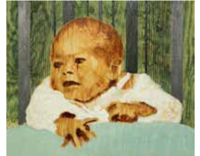
Nykläckt Olja & grafit på plywood 40 x 48 cm, 2014 Pris 4 400:-