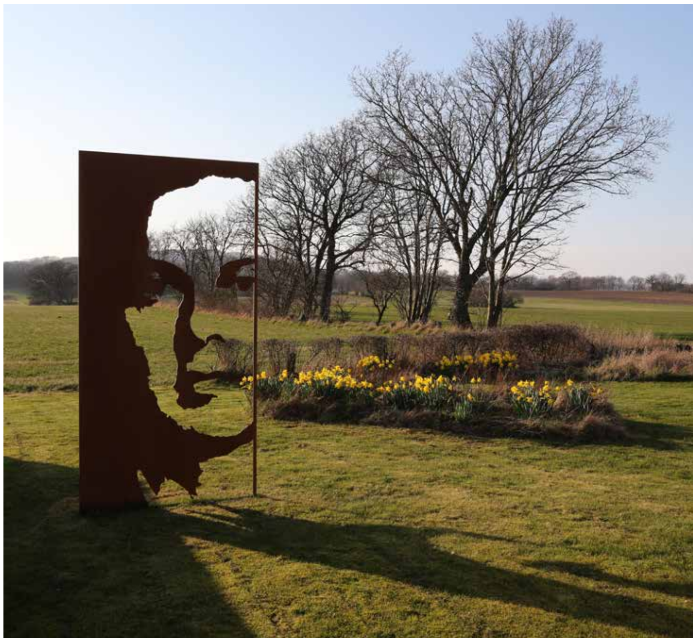
Transparent Personality Cortenplåt 10 mm 250 x 125 cm, 2013 Privat ägo