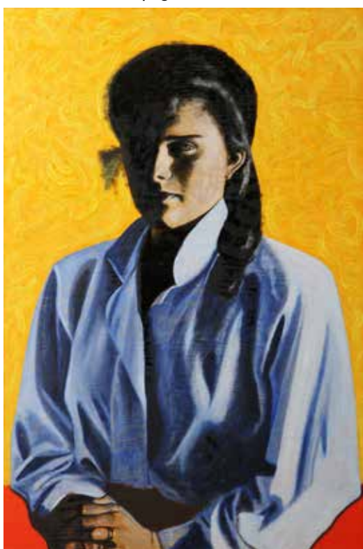
Once in a Lifetime Olja på plywood, 120 x 80 cm, 2010 Silverbröllopsgåva till Andrea