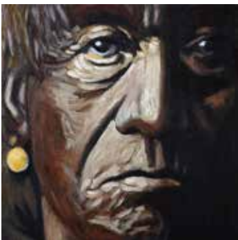
So, Sioux Me Olja på plywood 20 x 20 cm, 2016 Pris 3 500:-