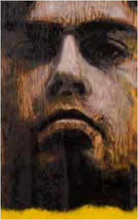
Metamorface III olja på plywood 64 x 40 cm, 2009 8 000:-