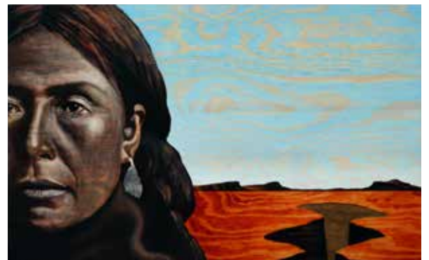
The Land They Lost, Olja, hornsten (chert) & lack på plywood 20 x 56 cm, 2017, Pris 8 000:-